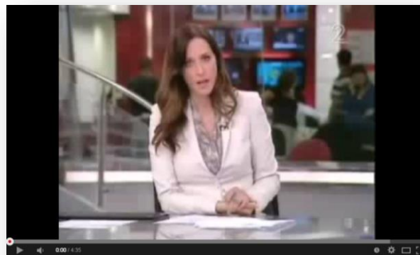
כתבה על דיבור-

הדיבור נפוץ בעיקר בסרטים מצוירים ובתרגום של סרטים ושל תכניות לשפה השונה משפת המקור, למשל: סדרת ה"דרדסים" מגיעה אלינו מבלגיה, ולכן במקור השפה המדוברת בסדרה היא פלמית. אתם שמעתם את הסדרה בעברית מאחר שהיא דוברת לעברית באולפן מקצועי.